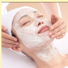
酵素洗顔部位 (額・頬・フェイスライン)

毛孔に詰まった汚れや皮脂を取り去ります。スチーマーの蒸気が毛孔を開かせることに作用します。適度な刺激を与えることで、リンパ液の流れを促進し、代謝を高めることが期待できます。